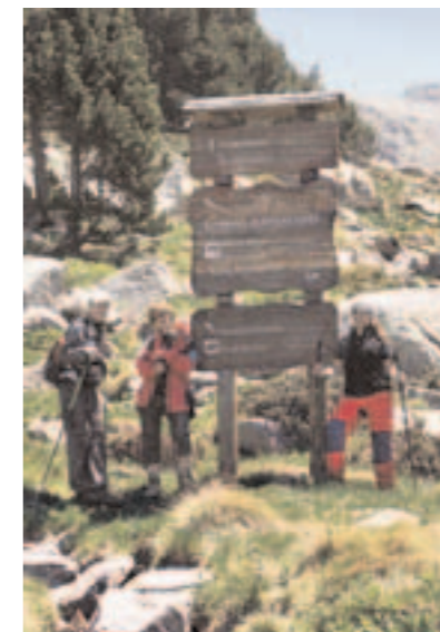
A la derecha, panel indicativo situado junto al sendero que une el lago y el refugio de Ensagents.

Es, precisamente, en el centro del pueblo de Encamp donde comienza y acaba una travesía circular que recorre las montañas y refugios de la parroquia. Esta travesía, bautizada con el nombre de Camí de l'Óssa, ha sido diseñada pensando en quienes desean iniciarse en el excursionismo pirenaico. Su moderada longitud, 36 kilómetros, dividida en dos etapas, la hacen especialmente atractiva para quienes no conocen sus límites y no se atreven con travesías de mayor longitud. Aunque en el transcurso del recorrido se pasa por cuatro refugios e infinidad de cabañas, al ser todos ellos de uso libre, obligan al caminante a llevar consigo lo necesario para evolucionar en total autonomía durante dos días.