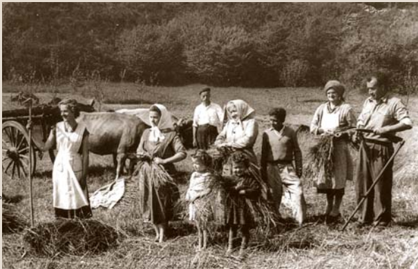
Fondo Museo Etnográfico del Oriente de Asturias

D URANTE LOS SIGLOS XVIII Y XIX, la comarca que rodeaba la Sierra de Cuera, como el resto de la franja cantábrica, practicaba un tipo de economía campesina de subsistencia. Las mejores tierras eran utilizadas para obtener cosechas de cereales (escanda, maíz, etcétera) y otros alimentos necesarios, como las patatas, las verduras y las legumbres. A su vez, la intrincada morfología kárstica de gran parte de los terrenos de la franja septentrional cercana a la sierra los hacía poco propicios para la explotación agrícola. La carencia de buenos terrenos para las actividades agrícolas y ganaderas en los valles llevó a sus habitantes a aprovechar intensivamente los terrenos comunales serranos para que pastaran sus ganados, y lograron un aprovechamiento integral del conjunto de recursos que ofrecían tanto las tierras bajas como las medias y altas, a través de complejos sistemas de organización temporal de explotación del espacio que les permitieron extraer los recursos necesarios para alimentar el ganado. De esta manera, los habitantes de los pueblos de las inmediaciones de Cuera llevaban a cabo una trashumancia entre las tierras bajas, que utilizaban para invernar sus rebaños, y las