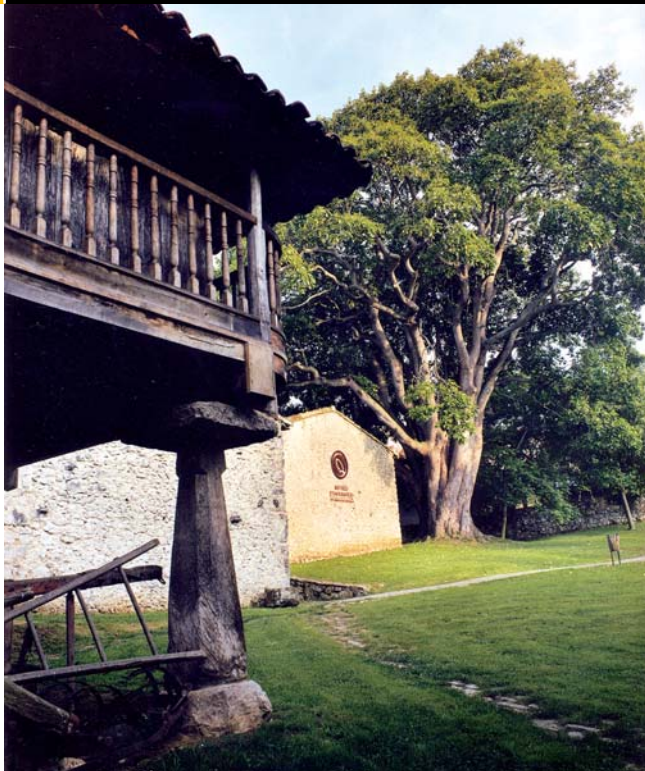
El Museo Etnográfico del Oriente de Asturias en Porrúa, creado por su asociación vecinal El Llacín.

vida de las comunidades serranas, las construcciones y la realidad ganadera de gran parte del recorrido que nos proponemos acometer.