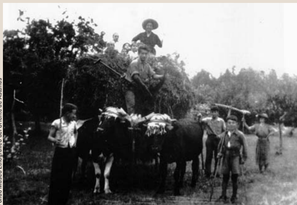
Volviendo de ahénar por el Caleyú. 1955.

altas, donde pastaban en verano. El ganado ovino fue el predominante durante estos siglos en la Sierra de Cuera y de él obtuvieron los pastores importantes insumos, como la leche y la lana, materias primas que, una vez transformadas en queso y paño, eran la mejor forma de conseguir recursos monetarios para comprar aquellos productos que la economía de subsistencia no era capaz de aportar.